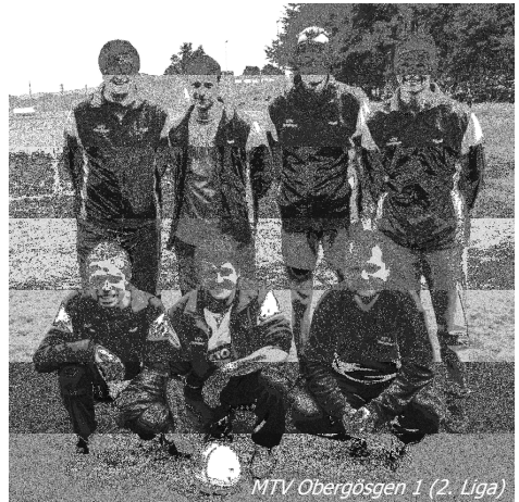
MTV Obergösgen 1 (2. Liga)

Das Fanionteam des MTV Obergösgen spielte diese Saison in der kantonalen Meisterschaft in der 2. Liga mit. Nach einem 2-jährigen Gastspiel in der 1. Liga musste Ende der letzten Saison der Abstieg hingenommen werden. Ihr Ziel, sich in der Spitzengruppe der 2. Liga halten zu können, haben die Faustballer mit dem 2ten Schlussrang erreicht. Dieser 2te Schlussrang berechtigt auch zur Teilnahme an der Aufstiegsrunde für die 1. Liga.