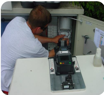
Fibre-Optik Spezialist am Spleissen der Glasfasern bei einer Node

Am 25. April 2013 wurde anlässlich der Generalversammlung der Fernsehgenossenschaft Oberröthenbach die Entscheidung getroffen, das bestehende Glasfasernetz von zwei LWL-Übergabestellen (Nodes) auf zehn Nodes auszubauen. Dieser Ausbau wurde der Firma Wiedmann-Dettwiler Comtec AG in Schönenwerd in Auftrag gegeben.